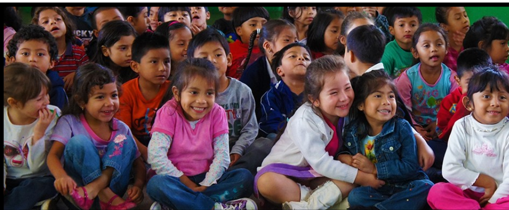
Los niños deleitados disfrutando de la obra "Conejo y Mapache."